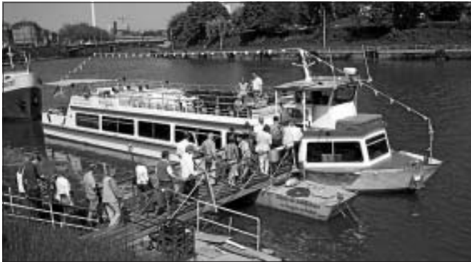
Die SPD in der Region Stuttgart lädt ein zu einer Neckarschiffahrt.

Zu einem ganz besonderen Ausflug lädt die SPD in der Region Stuttgart für den Pfingstmontag, den 1. Juni ein. Für eine Schiffsfahrt haben wir die "Liberty" vom Neckar-Käpt'n gechartert. Um 10 Uhr geht die Reise los. Startpunkt ist die Anlegestelle gegenüber von der Wilhelma in Stuttgart-Bad Cannstatt. Die Fahrt geht nach Marbach am Neckar, wo das Schiff kurz vor 13 Uhr erwartet wird. In Marbach gibt es Gelegenheit zu einer Stadtführung, die vom Marbacher SPD-Ortsverein organisiert wird - im Schillerjahr 2009 besonders lohnend.