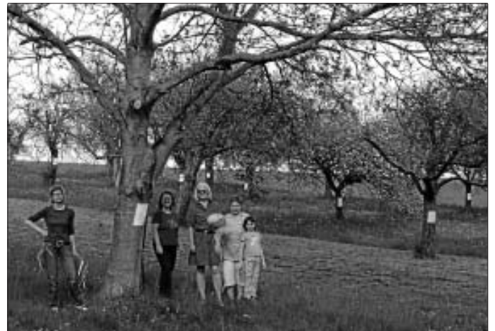
Gegen das Baumsterben im Ellenberg III

Am Tag des Baumes, Samstag, 25.4., traf sich eine Gruppe Grüner und ein paar interessierte Bürger und Bürgerinnen zur Begehung und Besichtigung des geplanten Neubaugebietes Ellenberg III. Im Ellenberg III sollen auf ungefähr 2,5 ha Ackerland und Streuobstwiesen ca. 60 Einfamilienhäuser entstehen. Für die Erdmannhäuser Grünen ist dieser Plan angesichts des demografischen Wandels und der ausufernden Flächenversiegelung im Landkreis Ludwigsburg ein Unding. Solange das Baugebiet Lauweinberg nicht verkauft und bebaut ist brauchen wir kein zusätzliches Neubaugebiet. Solange die innerörtlichen Brachflächen nicht genutzt und bebaut und leer stehende Häuser im Ort nicht bewohnt sind, brauchen wir kein Ellenberg III.