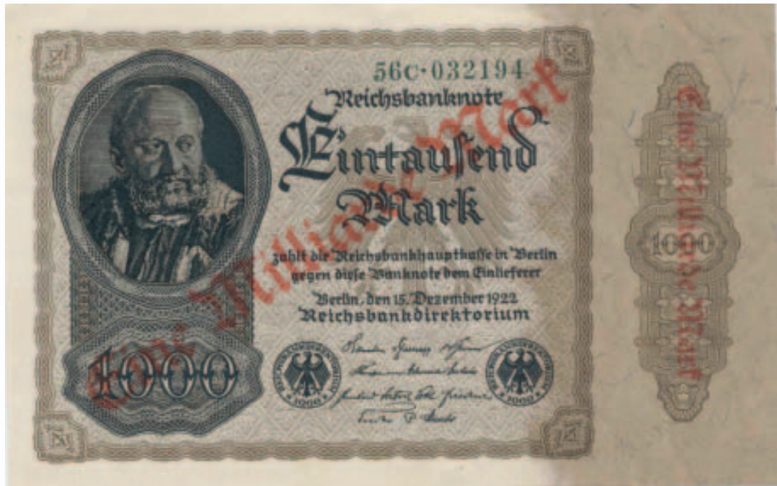
Eine Milliarde Reichsmark zur Zeit der Hyperinflation 1923 (Artikel siehe Seite 3).