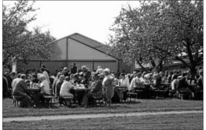
Gemütliches Beisammensein beim Hof- und Waldfest des Musikvereins Erdmannhausen

wir unseren jüngeren Musikerinnen und Musiker ein Lob aussprechen: Einige spielen sowohl in der Aktivenkapelle als auch in der Teenie-Band mit. Das bedeutet, dass sie kaum eine Spielpause hatten und tapfer durchgehalten hatten. Dafür haben sie jetzt aber einen super Ansatz!!! Unsere fleißigen Hände vom Wirtschaftsbereich und die Teenies haben für Ihr leibliches Wohl gesorgt. Pünktlich zum Spielbeginn kam die Sonne raus und begleitete uns den ganzen Tag. Einfach genial.