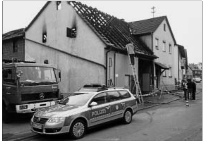
3.) Die Scheune ist vom Brand total zerstört und das Wohnhaus schwer beschädigt worden.

Auch die Berufsfeuerwehr Ludwigsburg kam mit 3 Mann nach Erdmannhausen zum Einsatz, mit dem Atemschutzgerätewagen (ASGW), da große Mengen an Atemschutzgeräten benötigt wurden. So konnten die Geräte schnell überprüft und wieder in Einsatz gebracht werden. Außerdem wurden mit der Ludwigsburger Wärmebildkamera versteckte Glutnester ausfindig gemacht.