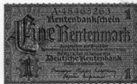
Originalgröße etwa wie ein 5-Euro-Schein

Millionen von Bürgern hatten ihre Spareinlagen verloren, deren Zinsen ihrer Alterssicherung hätten dienen sollen. Um die Währungsverhältnisse zu stabilisieren, wurde Mitte Oktober 1923 die Rentenbank gegründet, die vom 15. November an die Rentenmark ausgab. Die neue Währung wurde durch eine Grundschild auf den landwirtschaftlichen Besitz und durch die deutsche Hochfinanz gestützt. Eine Rentenmark entsprach einer Billion Papiermark, 4,2 Billionen Papiermark einem Dollar.