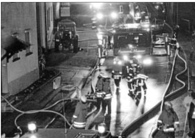
2.) In der Piemonteser Straße ging es ausgesprochen eng zu, was die Arbeit der Helfer zusätzlich erschwerte.

Darüber hinaus forderte Einsatzleiter Reiner Glock die Feuerwehr Affalterbach an. Diese kam mit einem weiteren Löschfahrzeug (LF 20) und einem Mannschaftstransportwagen (MTW) nach Erdmannhausen und übernahm insbesondere die Löscharbeiten innerhalb des Gebäudes.