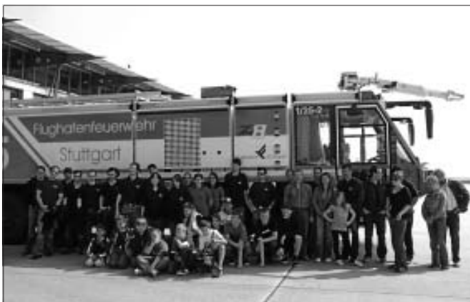
Die gesamte Gruppe vor einem der Löschfahrzeuge

Am Flughafen angekommen, mussten wir durch alle Abfertigungshallen bis ganz nach hinten zum Terminal 4 laufen, wo wir von einem Mitarbeiter der Flughafenfeuerwehr empfangen wurden. Wie richtige Fluggäste mussten auch wir die Personenkontrolle passieren, da wir ja schließlich in den Sicherheitsbereich gingen. Als dann endlich alle im "grünen Bereich" waren, stiegen wir in den Bus der Flughafenfeuerwehr, mit dem es einmal um das komplette Flughafengelände ging.