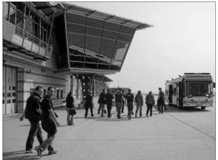
Nach Besichtigung der Wache ging's zurück zum Airport

Zuletzt fuhren wir wieder zu den Terminals, wo wir gemeinsam eine Kleinigkeit aßen, bevor jeder etwas Zeit zur freien Verfügung hatte, um den Flughafen auf eigene Faust zu erkunden.