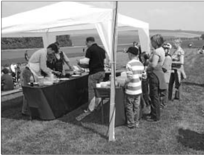
MVE-Teenie-Stand beim Verkauf der Waffeln

Ab 13:15 Uhr spielte die Teenie-Band auf der großen Bühne, was besonderen Spaß machte bei diesem genialen Wetter und den vielen Zuhörern.