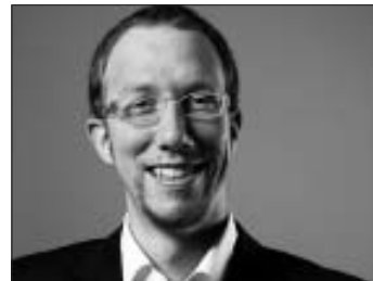
Der SPD-Bundestagskandidat Thorsten Majer.

Das Wahlkampfbüro des SPD-Bundestagskandidaten im Wahlkreis Neckar-Zaber hat jeden Mittwoch und jeden Freitag von 17.00 bis 19.00 Uhr geöffnet. Unter der Telefonnummer 0 71 42 / 77 14 93 können Sie mit dem Team Majer Kontakt aufnehmen. Wir freuen uns auch auf Ihren Besuch zu den genannten Öffnungszeiten.