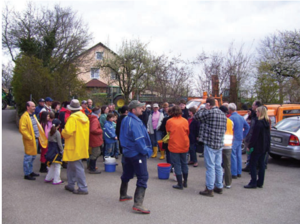
Der OGV führt seit 30 Jahren regelmäßig Markungsputzeten durch. Das Foto stammt von der Markungsputzete 2008.

Immer wieder wird achtlos oder bewusst Müll in der Erdmannhäuser Feldflur weggeworfen und in manchen Bereichen, besonders entlang der Zufahrtsstraßen, sieht es oft schlimm aus.