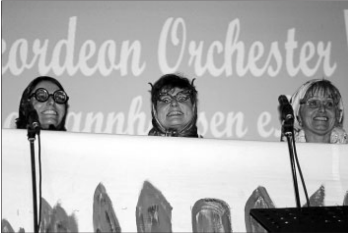
Aschenputtels "Häßliche Schwestern"