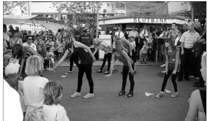
Die Hip-Hop-Gruppe des Jugendhauses Calypso legte eine tolle Choreography aufs Parkett.

te der Gastgeber seinen Ehrengast Siegfried Menner zuerst einmal mit einer Roten Wurst.